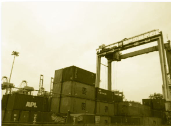
บริเวณท่าเรือ

3. Knowledge Hub ในส่วนของการพัฒนาสถาบันเกี่ยวกับการบิน การพัฒนาระบบซอฟต์แวร์ และกิจการรับจ้างบริหารระบบธุรกิจระหว่างประเทศ