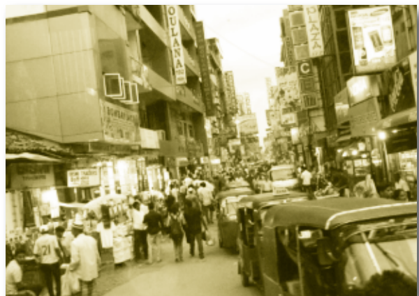
ย่านการค้าทั่วไป