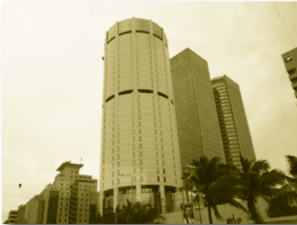
ย่านธุรกิจสำคัญของกรุงโคลัมโบ

อย่างไรก็ตาม แนวโน้มทางเศรษฐกิจของศรีลังกา จะขึ้นอยู่กับสถานการณ์ความมั่นคงเป็นสำคัญ แม้จะไม่เกิดภาวะสงคราม แต่การเพิ่มกำลังทางการทหารอาจส่งผลให้การขยายตัวทางเศรษฐกิจลดลง เนื่องจากอาจเกิดผลกระทบทางลบต่อการลงทุนและการบริการ โดยเฉพาะการท่องเที่ยว