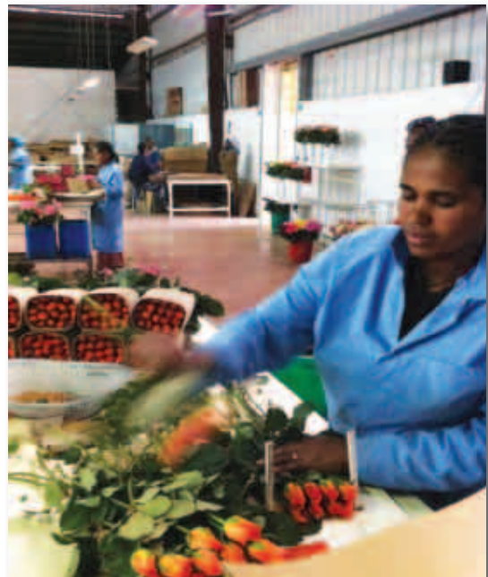
กาแฟและไม้ตัดดอกเป็นอุตสาหกรรมสำคัญของเอธิโอเปีย

ราคาถูก ที่ยังไม่ถูกขูดคั้นนำมาใช้ สินค้าที่ผลิตได้จะได้รับสิทธิพิเศษทางการค้าจาก EU และสหรัฐฯ ปัจจุบันเป็นภูมิภาคที่ได้รับความสนใจจากประเทศมหาอำนาจทางเศรษฐกิจใหม่ เช่น จีน อินเดีย และ แอฟริกาใต้