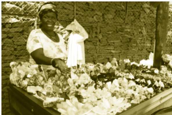
แหล่งทรัพยากรที่ร่อนักธุรกิจไทย

สื่อสารกันด้วยภาษารัสเซีย การพัฒนาทางเศรษฐกิจมีความแตกต่างกันตามทรัพยากรธรรมชาติที่มีในพื้นที่ เช่น คาซัคสถานจะเป็นผู้รั่วรอยที่สุดจากทรัพยากรน้ำมัน ในขณะที่ อุซเบกิสถานอุดมสมบูรณ์ด้วยการเกษตร คีร์กีซสถานเป็นพื้นที่ภูเขาที่มีทรัพยากรแร่ธาตุมีค่า เป็นต้น การที่ตั้งอยู่ในพื้นที่ไม่ติดทะเลทำให้การค้าขายติดต่อกับโลกภายนอกจึงต้องผ่านประเทศที่สาม สินค้า